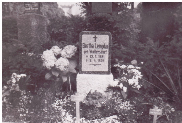
Ihr Grab auf dem Georgenfriedhof.